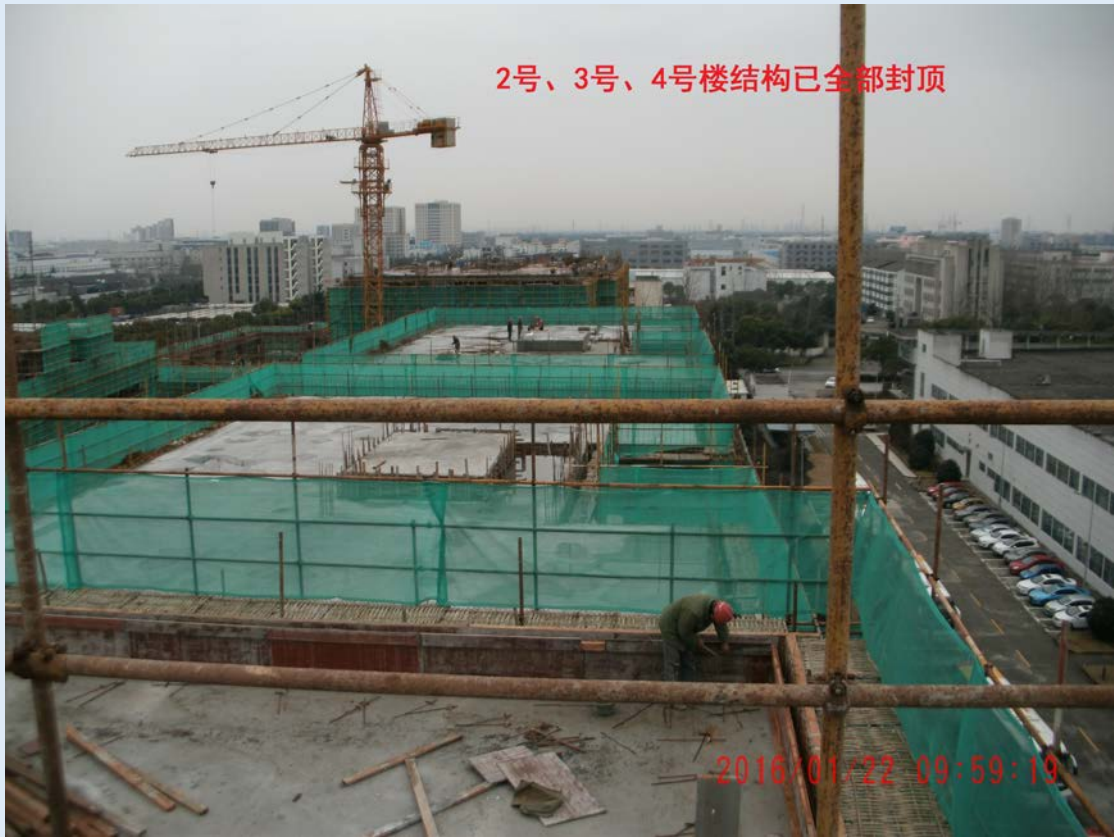
2号、3号、4号楼结构已全部封顶