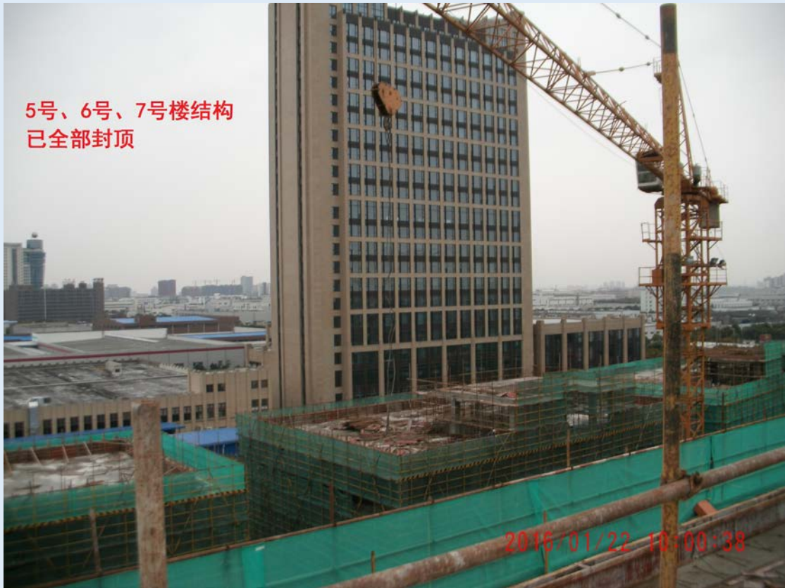
5号、6号、7号楼结构已全部封顶